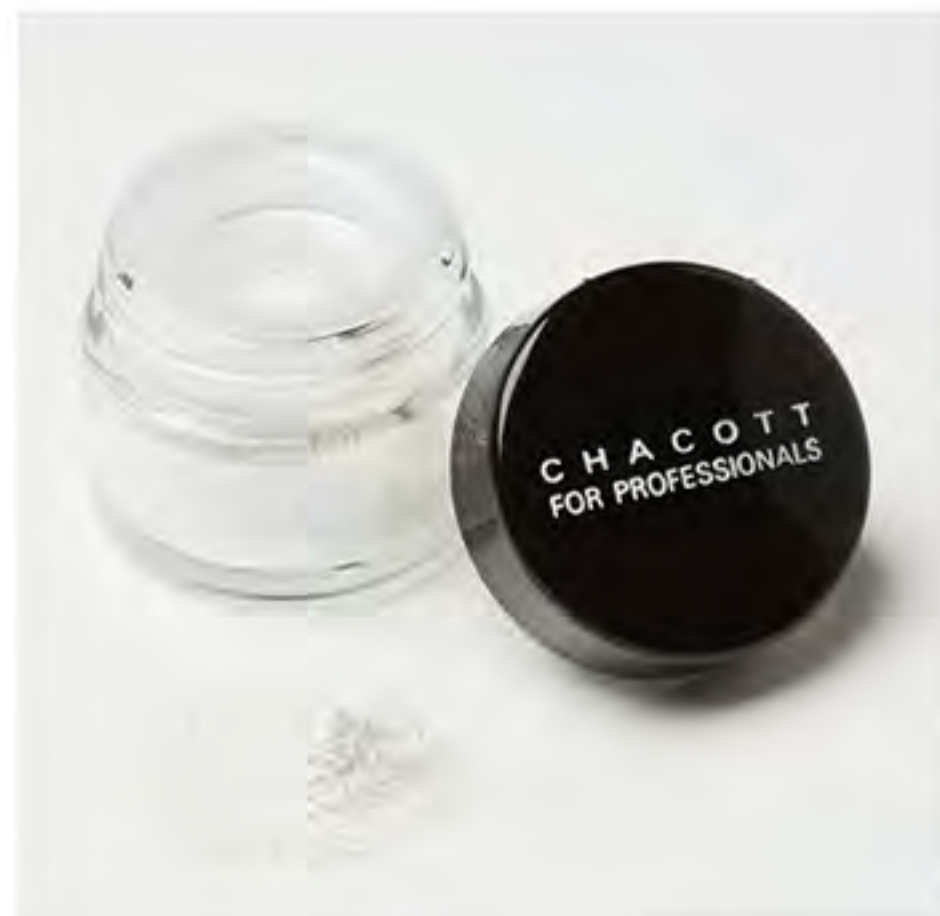
ウィンキングシリーズ グラスパウダー 503616-0色番3桁-58 ¥2,000+税 容量：2g