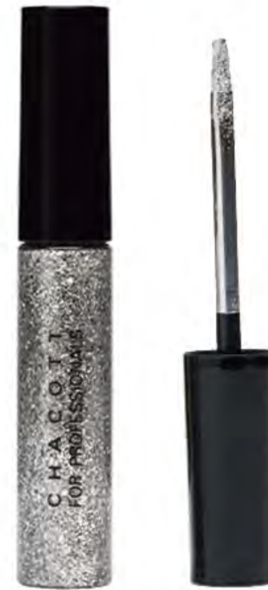
メイクアップカラーバリエーション ラメグリッター 503617-0色番3桁-58 ¥2,800+税 容量：9g