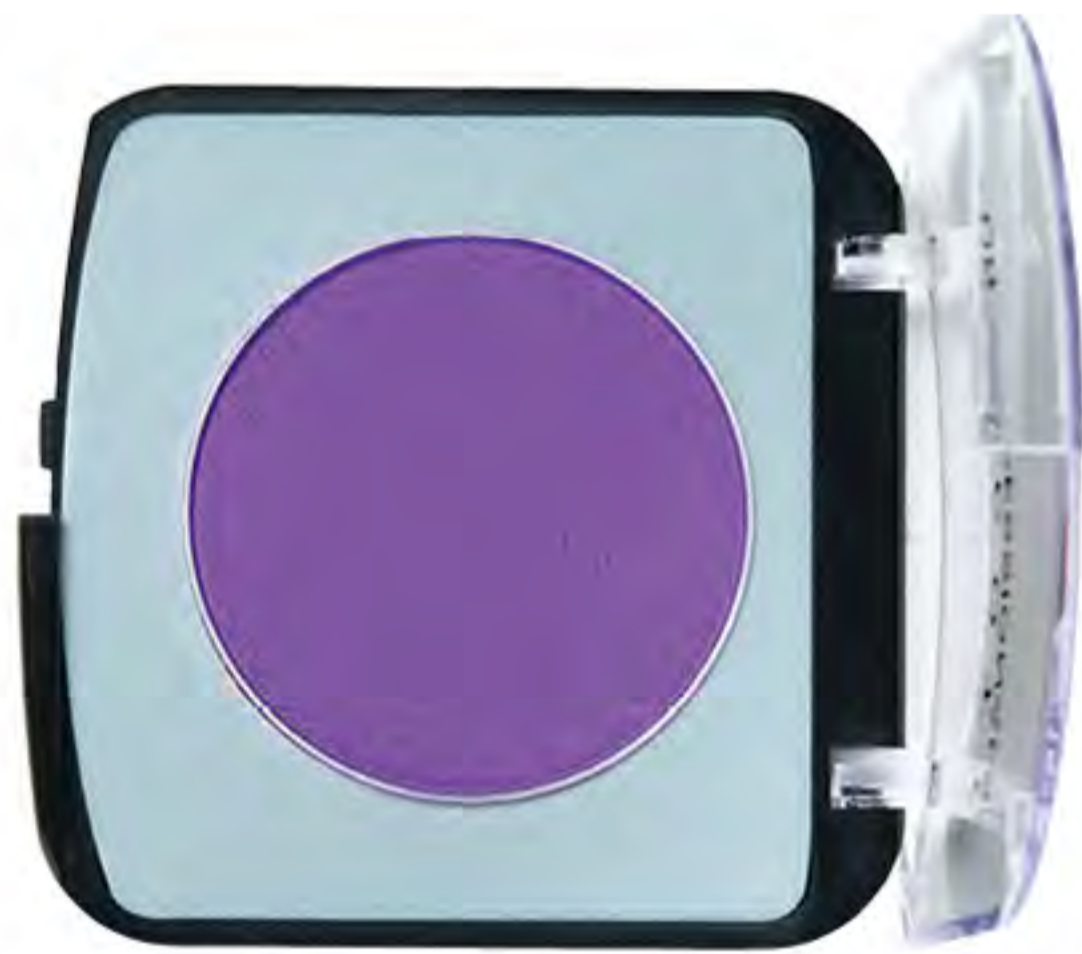
メイクアップカラーバリエーション ウィンキングシリーズ 503619-0色番3桁-58 ¥1,200+税 容量：4.5g