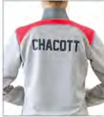
ジャケットバックスタイル