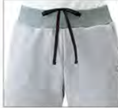
パンツウエスト部分