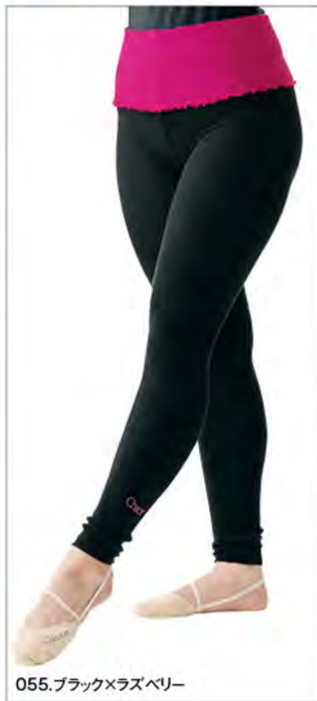
055.ブラック×ラズベリー