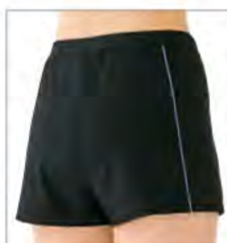
074.ブラック×バイオレット