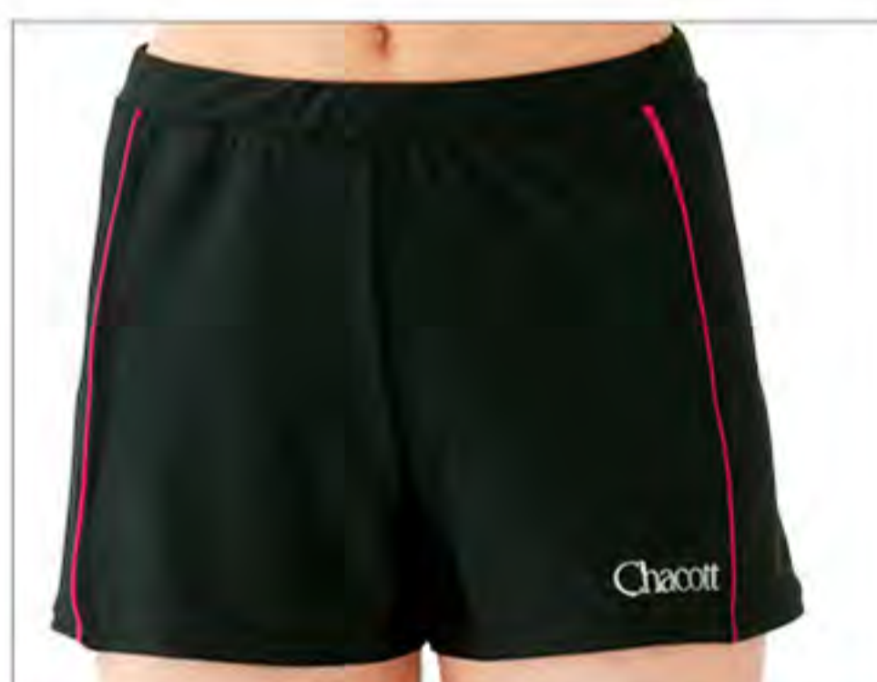
047.ブラック×ショッキングピンク