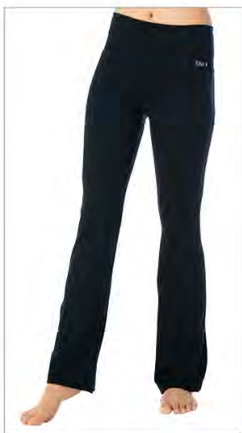
ASANA ロングスパッツ (6月発売) [ ALL ]