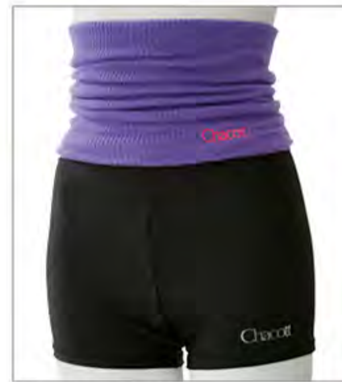
074.バイオレット×ブラック

□ぴったりとしたシルエットで激しい動きでもずり落ちにくくあたたかい □ウエスト部分はハイウエストでも着用できる2WAY仕様 ※055.ブラック×ラズベリーは9月発売予定