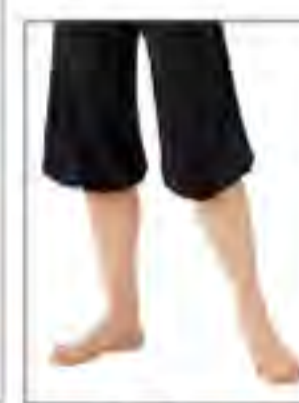
裾ゴム入りで絞れる