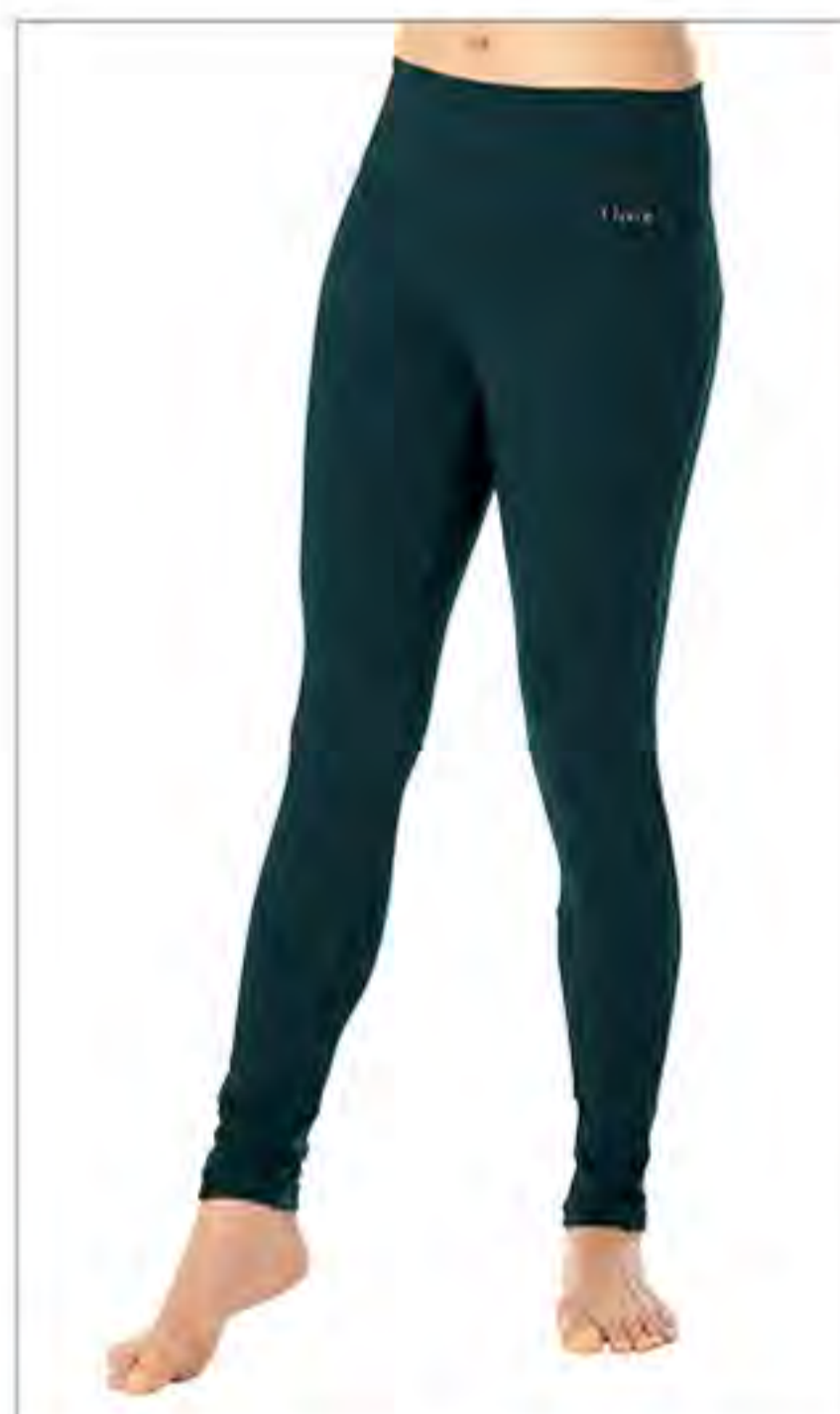
ロイヤルレギンス