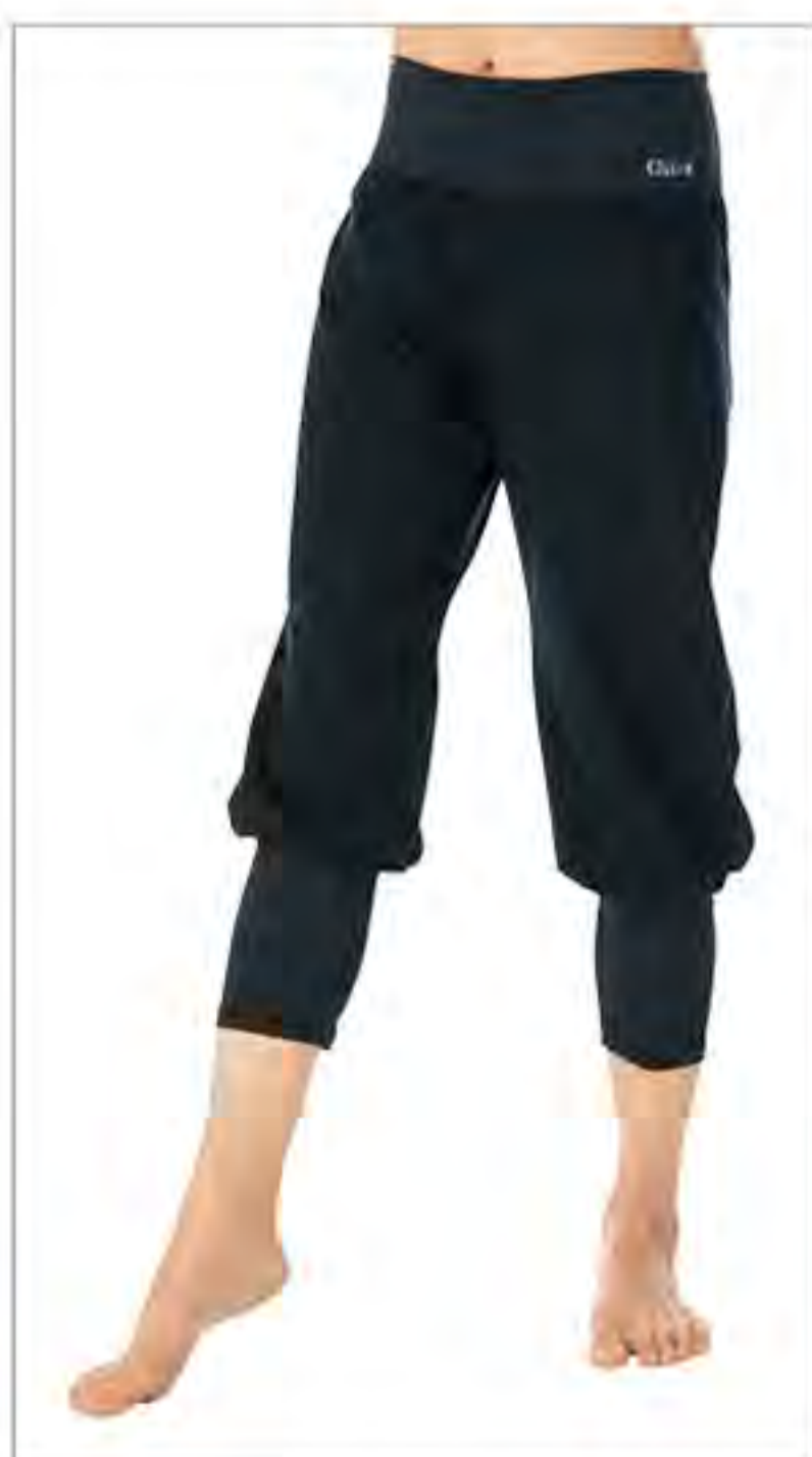
空 (KUU) ニーレングスパンツ (6月発売) [ ALL ]