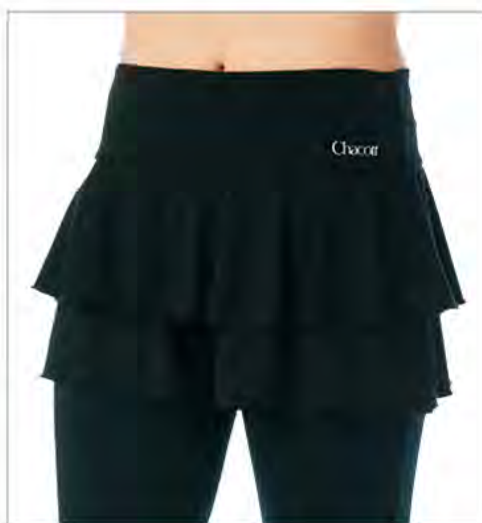
ティアードショートパンツ (6月発売) [ ALL ]