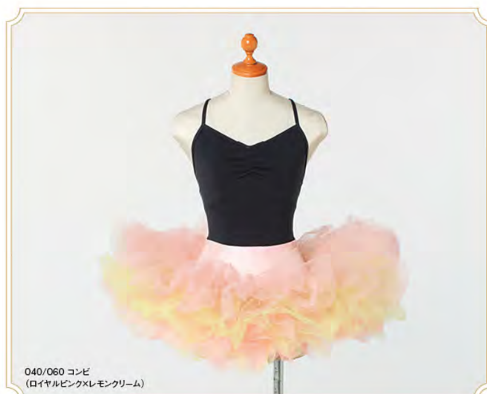
040/060 コンビ (ロイヤルピンク×レモンクリーム)