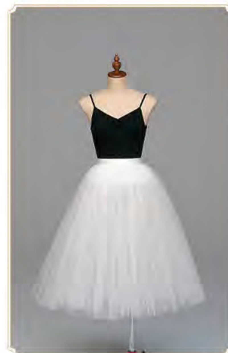
クラシックチュチュ・クラシックボン・ロマンティックチュチュ・ロマンティックボン(シャンタン) サイズ表(cm)