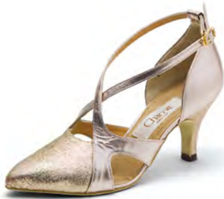
#7303 [BALLROOM DANCE]

100060-7303-58 ¥17,800+税 サイズ:22.0~24.5cm