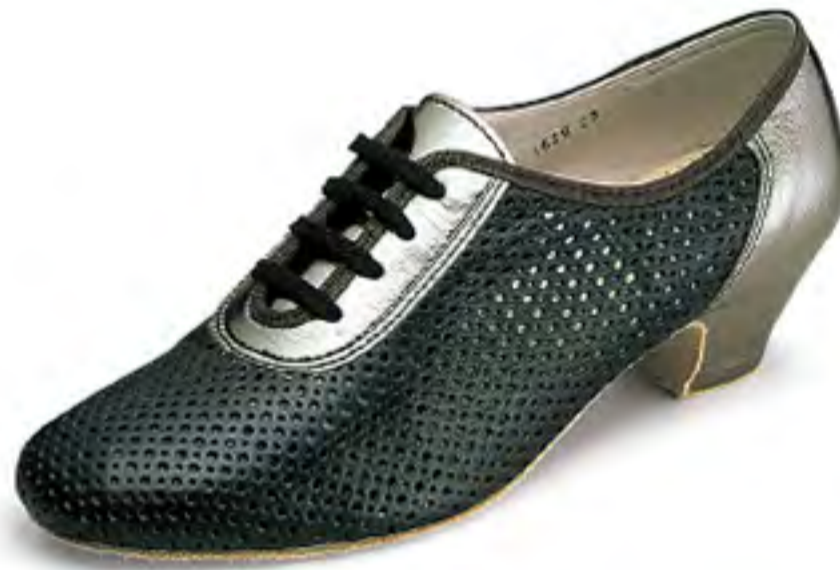
#1629 [BALLROOM DANCE]

100063-1629-58 ¥15,800+税 サイズ:21.5~25.0cm(☆)