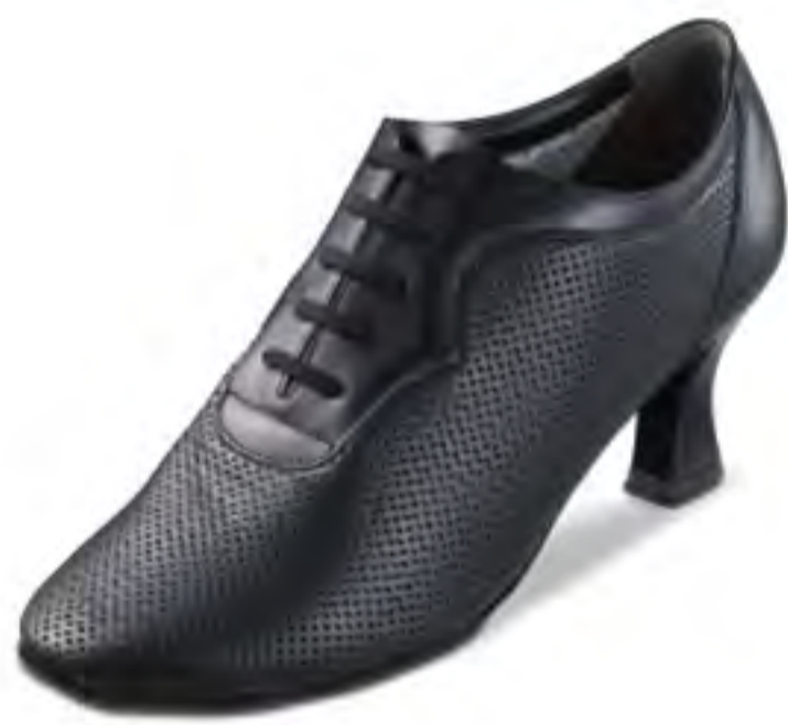
#8009T [BALLROOM DANCE]

100063-8009-58 ¥17,800+税 サイズ:21.5~25.0cm(☆)