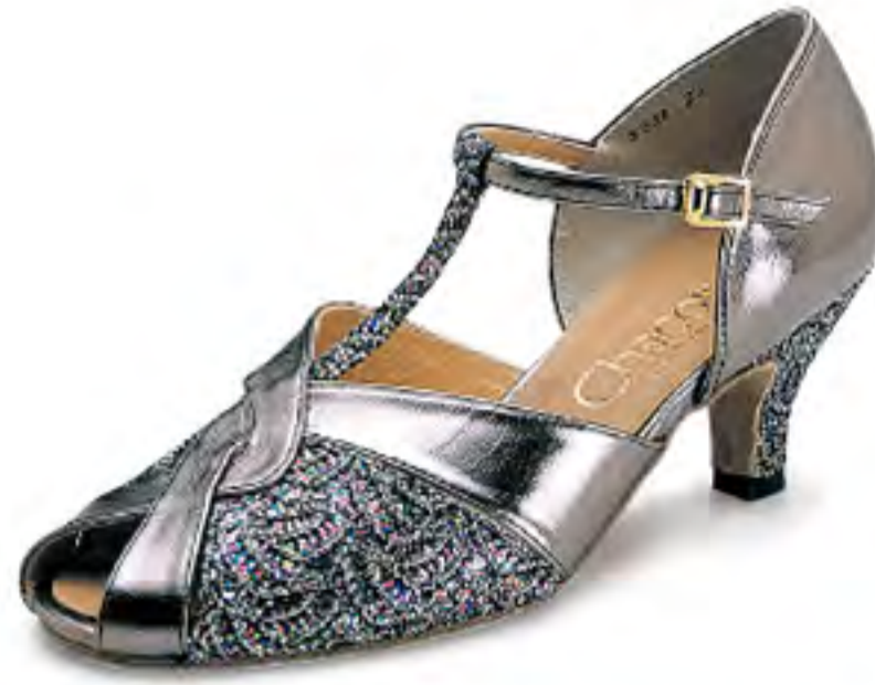
#5033 [BALLROOM DANCE]

100060-5033-58 ¥15,800+税 サイズ:22.0~24.5cm