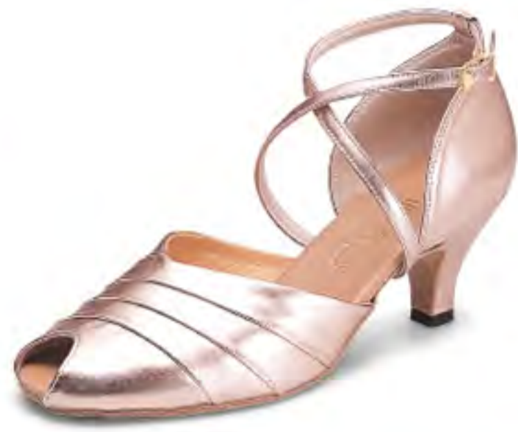
#5044 [BALLROOM DANCE]

100060-5044-58 ¥15,800+税 サイズ:22.0~24.5cm