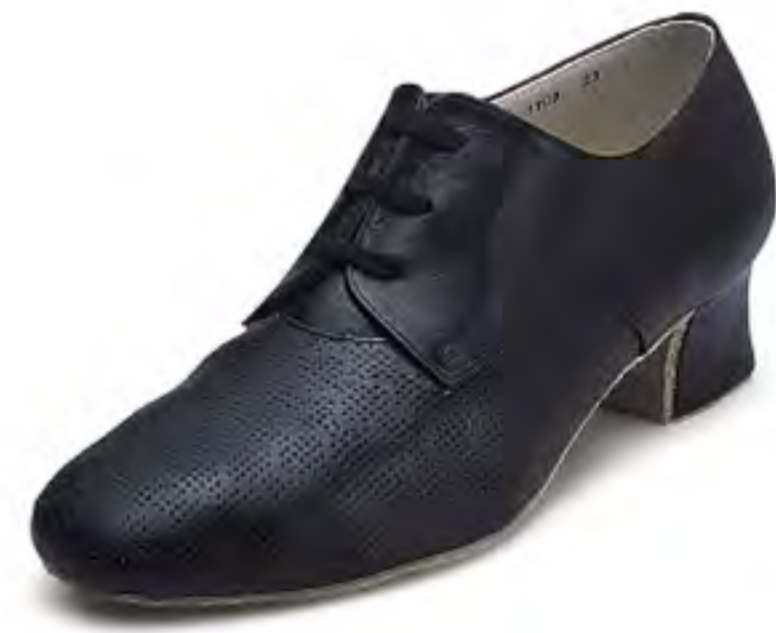
#1709 [BALLROOM DANCE]

100063-1709-58 ¥14,800+税 サイズ:21.5~25.0cm(☆)