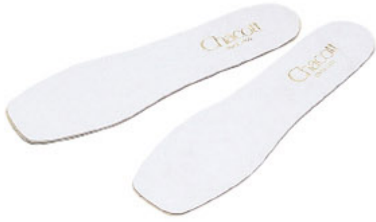
トゥシューズ用レザー中敷 012096-0067-58 ¥650+税 サイズ: L(22.0~26.0cm)