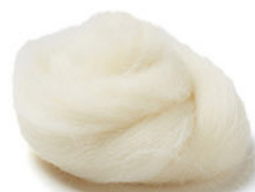
アニマルウール 012114-0081-58 ¥1,100+税 サイズ:約20g