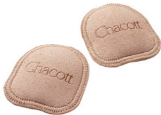
トゥシューズアーチサポートパッド 012097-0068-58 ¥1,800+税 サイズ:フリー