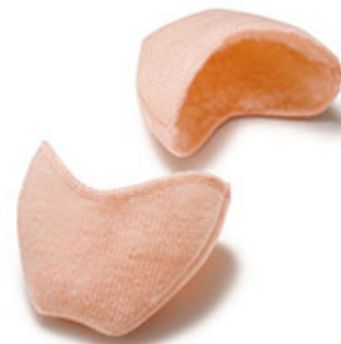
ブードルトウパッド 012091-0035-58 ¥1,100+税 サイズ:M(18.0~22.0cm)、 L(22.0~26.0cm)