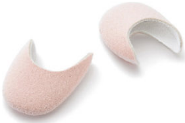
フリード トウパッド 012091-0031-58 ¥1,400+税 サイズ:S(17.0~21.0cm) M(21.0~24.0cm) L(24.0~27.0cm)