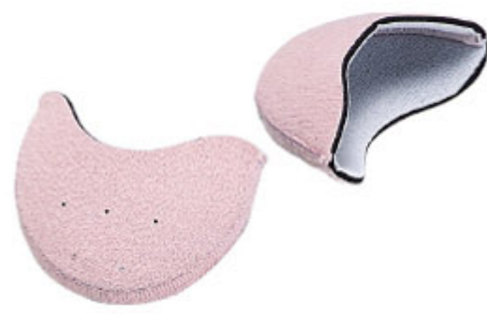
ソフトラバートウパッド 012091-0032-58 ¥1,400+税 サイズ:M(18.0~22.0cm) L(22.0~26.0cm)