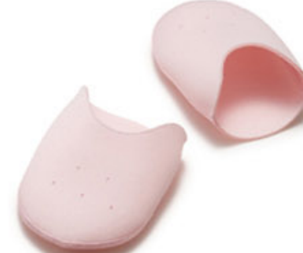
フリーカットジェルトゥパッド 012091-0034-58 ¥2,900+税 サイズ:M(21.0~24.0cm) L(24.0~27.0cm)