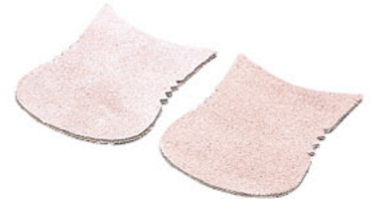
ボワントパッド(レザー) 012097-0069-58 ¥100+税 サイズ:SS、S、M、L