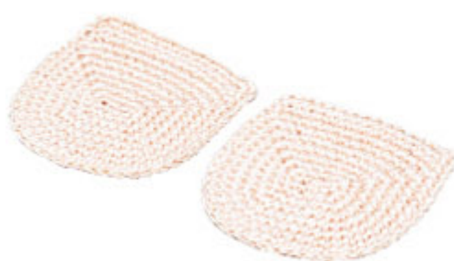
ボワントパッド(レース編) 012097-0070-58 ¥350+税 サイズ:フリー