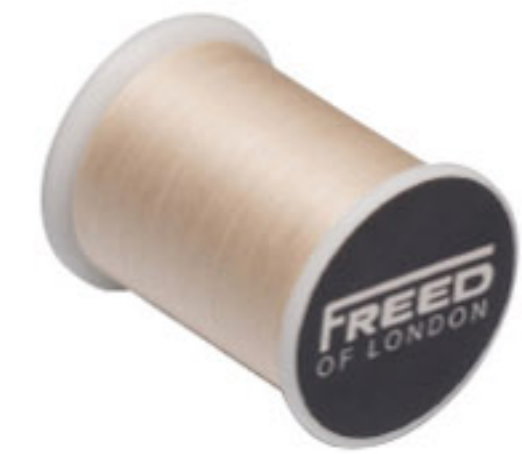
フリード トウステッチ 012094-0065-58 ¥600+税 サイズ:約30m