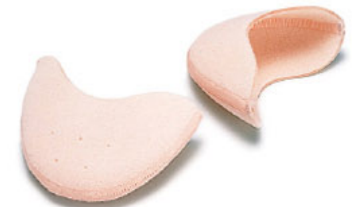
ジェルトゥパッド 012091-0033-58 ¥2,600+税 サイズ:M(18.0~22.0cm) L(22.0~26.0cm)