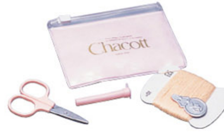
シューズソーイングセット 012093-0064-58 ¥700+税 サイズ:約8×10.5cm