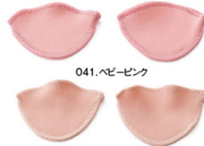
スムーズ地トゥパッド 012091-0036-58 ¥200+税 サイズ:フリー