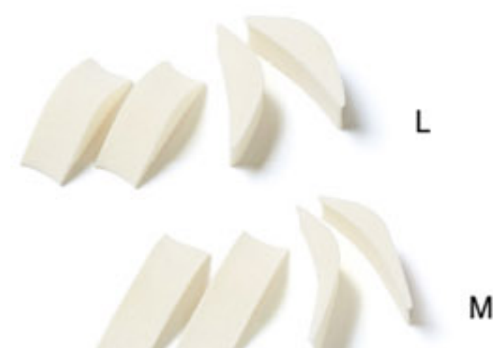
小指パッド 012097-0071-58 ¥700+税 サイズ:M、L